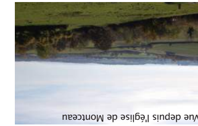
Vue depuis l'église de Montceau www.ot-cantondeblignysurouche.fr Ouche et sur le site Tourisme du Canton de Bligny-sur- Ouche et commerces à l'Office de Liste des hébergements, restaura- Renseignements pratiques