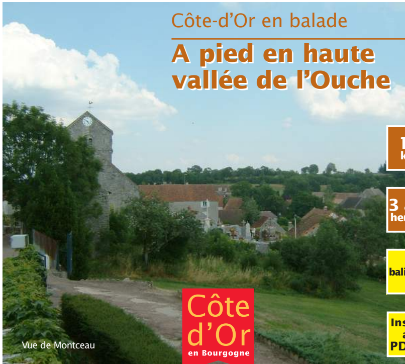
Vue de Montceau